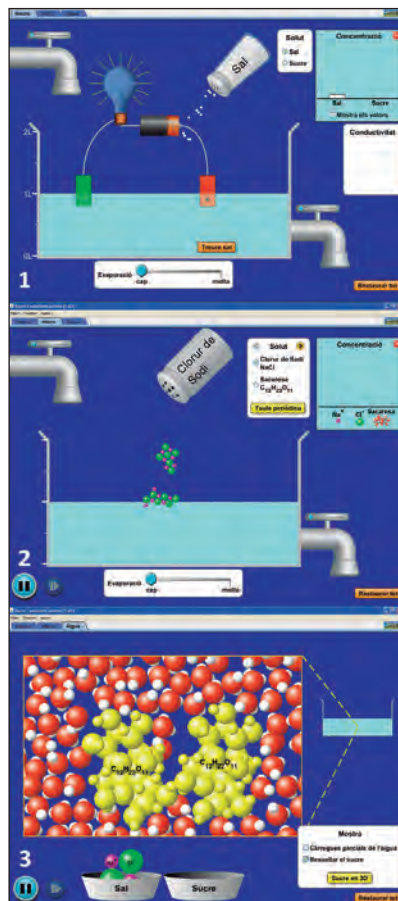
Figura 4. Captura de pantalla de la simulació Sucre i solucions salines, en què es representa la dissolució de la sal comuna i del sucre en aigua a tres nivells: 1) completament macroscòpic, en el qual es pot mesurar la conductivitat; 2) una combinació del macroscòpic i el microscòpic, i 3) una representació del nivell microscòpic.

Algunes preguntes que poden ajudar a desenvolupar el model són les següents: «Quins són els elements que es representen en la simulació?», «Què succeeix en l'àmbit de les partícules quan el clorur de sodi es dissol en aigua?» i «Quina relació podem trobar entre la simulació i el que hem observat al laboratori?»