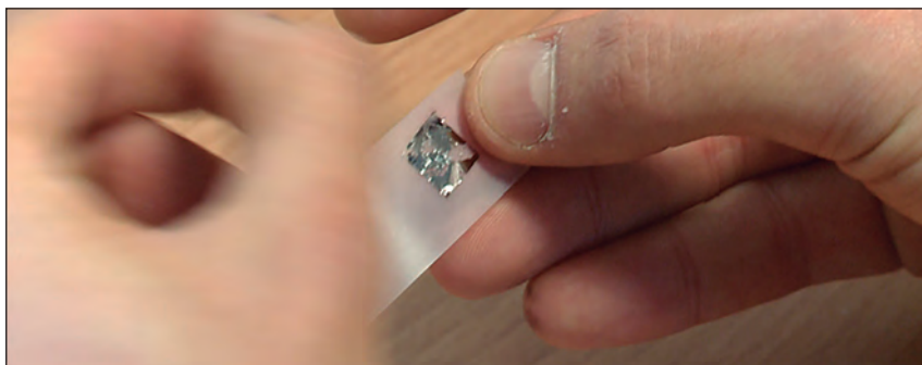
Figura 2. Imatge d'un vídeo sobre l'electrònica basada en el grafè.

L'objectiu d'aquesta sessió és que els estudiants siguin capaços d'identificar algun patró que es repeteix en les dades recollides, és a dir, una característica que sigui comuna en alguns materials i en d'altres, no (per exemple, la conductivitat en estat sòlid o el color).